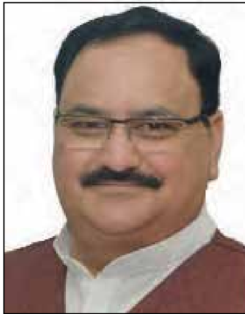
श्री जगत प्रकाश नड्डा Shri Jagat Prakash Nadda

सम्माननीय स्वास्थ्य एवं परिवार कल्याण संघ कैबिनेट मंत्री Hon'ble Union Cabinet Minister for Health & Family Welfare