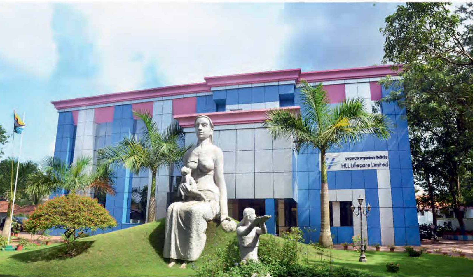
HLL's Corporate Headquarters at Thiruvananthapuram, Kerala