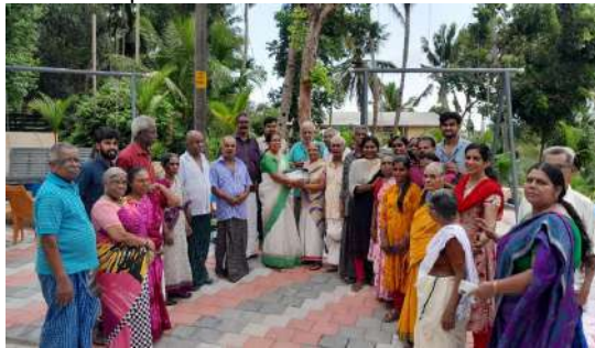
Celebration of World Environment Day

HLFPPT with the support of Department of Social Justice, Government of Kerala is operating a 247 model old age home in three districts of Kerala namely Kannur, Kollam and Malappuram. The project is being successfully run as "Second Innings Home". The renovated home gives a lively ambience, good health care facilities, and organises many activities to engage elderly people. The centre provides elderly-friendly services, which are easily approachable, usable and user friendly. The home is equipped with unique ideas like emergency bell switches, railing support, library cum reading room, laboratory facility, pharmacy, yoga room, food court for group dining, mini gymnasium, etc. To engage elderly residents in activities like flower pot making, tailoring etc. a small skill lab has been set up manned by social workers and health care professionals. Thus, the project envisages a Therapeutic home-based care facility for active daily living. Second Innings Home, Kollam has received the award for Best Institution for Senior Citizens under Social Justice Department.