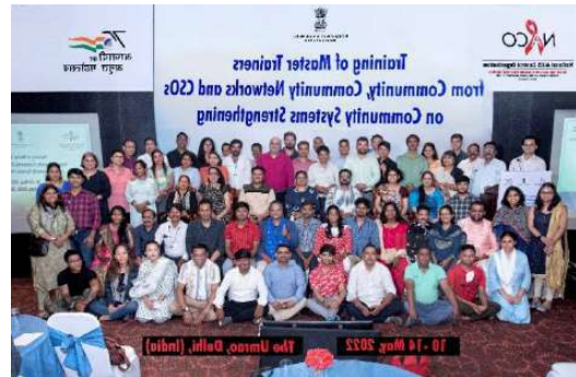
सीएसएस कार्यक्रम के अंतर्गत मास्टर प्रशिक्षकों का प्रशिक्षण