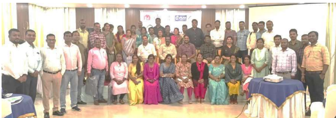
Orientation and Sensitization of key district Health Officials: Chhattisgarh