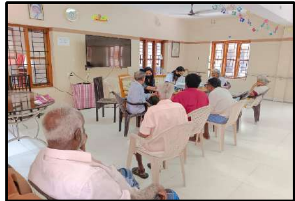
Outreach clinical services by HLPPT at Old Age Homes in Trivandrum