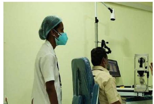
Ophthalmic camp for KSRTC employees