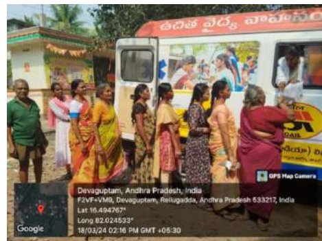
मोबाइल मेडिकल यूनिट में एमबीबीएस डॉक्टर द्वारा ओपीडी

वर्ष 2023-24 सी एस आर प्रभाग के लिए एक और सफल वर्ष रहा है, क्योंकि हमने अपने सी एस आर कार्यक्रम पोर्टफोलियो को बढ़ाने के लिए कॉर्पोरेट्स और पीएसयू के साथ नई सी एस आर साझेदारियाँ स्थापित की हैं। सी एस आर पहल ने भारत को बदलने में सतत विकास लक्ष्यों और सार्वजनिक निजी भागीदारी को प्राप्त करने के लिए एचएलएलएफपीपीटी को आगे बढ़ाया है। एचएलएलएफपीपीटी ने आई टी सी लिमिटेड, ओ टी पी सी (ओ एन जी सी की सहायक कंपनी), जेएसडब्लियु थेलकोलोई और पारादीप(ओडिशा), अप्रावा एनर्जी (सी एल पी इंडिया प्राइवेट लिमिटेड), ई एस एस ए आर ऑयल एंड गैस लिमिटेड दुर्गापुर (पश्चिम बंगाल), हिंडाल्को, आई टी सी सहारनपुर(उत्तर प्रदेश) और मुंगेर (बिहार), एन टी पी सी बाढ़ और बरौनी (बिहार), एन टी पी सी मौदा (महाराष्ट्र), एन टी पी सी कवास (गुजरात), एन टी पी सी रामागुंडम (तेलंगाना) हीरो मोटो कॉर्प लिमिटेड हरिद्वार (उत्तराखंड), जयपुर (राजस्थान), दारुहेड़ा (हरियाणा), हलोल (गुजरात) और चित्तूर (आंध्र प्रदेश), एन एम डी सी बस्तर (सी जी), और ओ टी पी सी धलाई और गोमती (त्रिपुरा) जैसे प्रसिद्ध संगठनों/कॉर्पोरेटों के साथ साझेदारी की है।