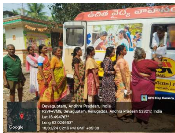
OPD by MBBS Doctor in Mobile Medical Unit

HLPPT has been partnering with renowned organizations/ corporates such as ITC Limited, OTPC (a subsidiary of ONGC), JSW Thekoloi and Paradip (Odisha), Apraava Energy (CLP India Private Ltd.), ESSAR Oil and Gas Ltd Durgapur (West Bengal), Hindalco, ITC Saharanpur (Uttar Pradesh) & Munger (Bihar), NTPC Barh & Barauni (Bihar), NTPC Mauda (Maharashtra), NTPC Kawas (Gujarat), NTPC Ramagundam (Telangana) Hero Moto Corp Ltd Haridwar (Uttarakhand), Jaipur (Rajasthan), Daruhera (Haryana), Halol (Gujarat) & Chittoor (Andhra Pradesh), NMDC Bastar (CG), and OTPC Dhalai and Gomati (Tripura).