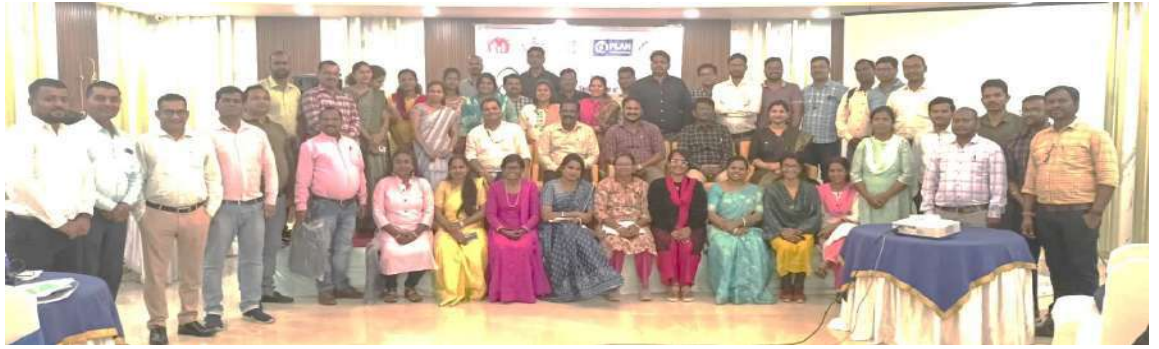
प्रमुख जिला स्वास्थ्य अधिकारियों का उन्मुखीकरण और संवेदीकरण : छत्तीसगढ़