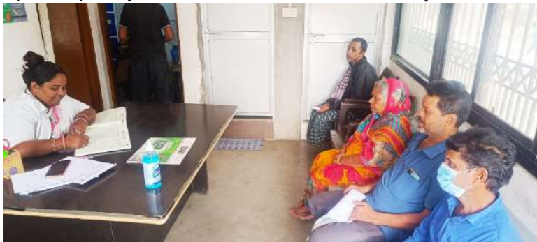
Patients Registration in Thelkoloi Dispensary, Odisha

We are operationalising and managing one community dispensary at Thelkoloi, Sambalpur (Odisha) and 1 Mobile Medical Unit (MMU) in Paradip (Odisha) with the support of Jindal Steel Works (JSW) to provide primary healthcare services to the community with an aim to ensure universal health coverage.