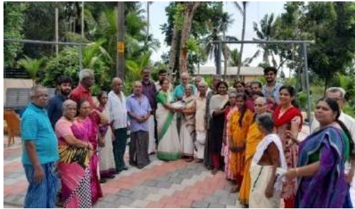
विश्व पर्यावरण दिवस समारोह

केरल सरकार के सामाजिक न्याय विभाग के सहयोग से एचएलएफपीपीटी केरल के तीन जिलों कन्नूर, कोल्लम, मलप्पुरम में 247 मॉडल वृद्धाश्रम का संचालन कर रहा है। परियोजना को सफलतापूर्वक “दूसरी इनिंग्स होम” के रूप में चलाया जा रहा है। पुनर्निर्मित घर बुजुर्ग लोगों को शामिल करने के लिए एक जीवंत माहौल, अच्छी स्वास्थ्य देखभाल सुविधाएं और कई गतिविधियाँ प्रदान करता है। यह केंद्र बुजुर्गों को अनुकूल सेवाएँ प्रदान करता है, जो आसानी से सुलभ, प्रयोग करने योग्य और यूजर फ्रेंडली है। घर अद्वितीय विचारों से सुसज्जित है जैसे आपातकालीन बेल स्विच, रेलिंग समर्थन पुस्तकालय सह वाचनालय, लैब सुविधाएं, फार्मसी, योगा कक्ष, समूह भोजन के लिए भोजनालय, छोटा व्यायामशाला आदि। फूलदान बनाने, सिलाई आदि गतिविधियों में बुजुर्ग निवासियों को शामिल करने के लिए सामाजिक कार्यकर्ताओं और स्वास्थ्य देखभाल पेशवरों द्वारा संचालित एक छोटी कौशल प्रयोगशाला स्थापित की गयी है। इस प्रकार, परियोजना सक्रिय दैनिक जीवन के लिए चिकित्सीय घर - आधारित देखभाल की परिकल्पना करती है। सामाजिक न्याय विभाग के अंतर्गत वरिष्ठ नागरिकों के लिए सर्वश्रेष्ठ संस्थान का पुरस्कार दूसरी इनिंग्स होम, कोल्लम को मिला है।