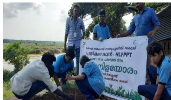
Cleaning Drive by inmates of Pratheeksha Bhawan on the occasion of World Environment Day