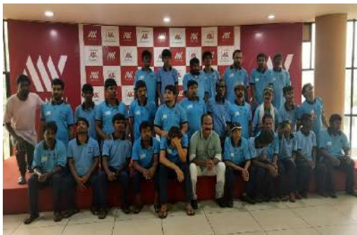
प्रतीक्षा भवन के निवासियों का औटिंग।

कमजोर दिव्यांग व्यक्तियों की देखभाल और उनके मानवाधिकारों की रक्षा करना समाज के लिए एक बड़ी चुनौती है। इन मानसिक रूप से अक्षम कैदियों के सामने आनेवाली कुछ प्रमुख समस्याएँ हैं मेडिकल और पैरामेडिकल स्टाफ की अनुपलब्धता, विकलांगों के लिए बुनियादी ढांच की कमी, मौजूदा चिकित्सा और अन्य परामर्श संसाधनों के लिए प्रशिक्षण की कमी। शिक्षा के लिए सीमित गुंजाइश, कौशल विकास, सक्रिय दैनिक जीवन, सामाजिक ज़रूरतों को पूरा करने के लिए सीमित मंच, प्रतिभा व्यक्त करने के लिए कम मंच है। इसलिए सामाजिक न्याय विभाग ने बुनियादी ढांचे के नवीनीकरण और उन्नयन के लिए एचएलएफपीपीटी 'प्रतीक्षा भवन, तवन्नूर को सौंपा है। एनएचएफडीसी और एचएलएफपीपीटी के बीच दीर्घकालिक सहयोग के साथ, हमें एचएलएफपीपीटी द्वारा विभिन्न परियोजनाओं में दिव्यांग लाभार्थियों द्वारा बनाए गए विभिन्न उत्पादों को प्रदर्शित करने और विपणन करने के लिए एक राष्ट्रीय प्रदर्शनी एवं बिक्री मेला - दिव्य कला मेला में आमंत्रित किया गया है। सामाजिक न्याय विभाग के अधीन दिव्यांग व्यक्तियों के कल्याण के लिए सर्वश्रेष्ठ संस्थान का पुरस्कार प्रतीक्षा भवन ने हासिल किया है।