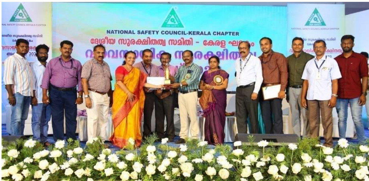
HLL Peroorkada Factory received BEST SAFETY COMMITTEE AWARD in very large categories other than Chemical & Engineering from National Safety council (Kerala Chapter)