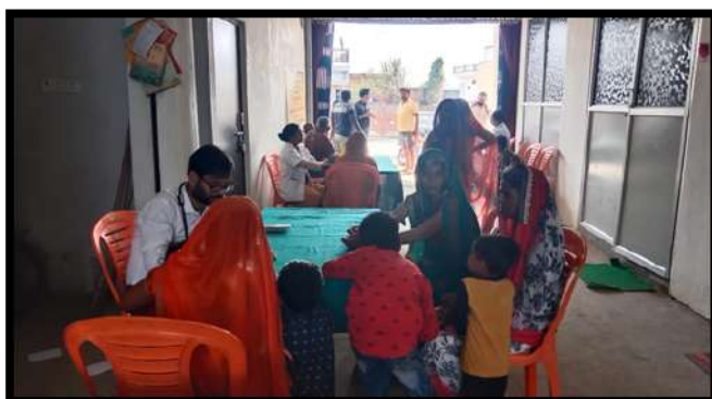
OPD Through special Health Camp

The current CSR initiatives under HLPPT are highly community driven, engage communities through Awareness and sensitization sessions for Social Behaviour Change Communication (SBCC), focuses on scalability and sustainability, to create stronger impact.