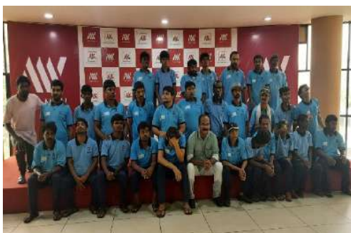
Outing of the Pratheeksha Bhawan inmates

Providing care and protecting the human rights of the vulnerable differently abled people stands as a big challenge for society. Some of the major issues faced by mentally disabled inmates are unavailability of Medical and paramedical staff, disabled unfriendly infrastructure, lack of training to existing medical and other counselling resources. There is also limited scope for education, skill development, active daily living, very less platforms for satisfying social needs and express talents. Therefore, Department of Social Justice has entrusted HLFPPT 'Pratheeksha Bhavan, Thavanur, to refurbish and upgrade infrastructure. With the long-term association between NHFDC and HLFPPT, we have been invited Divya Kala Mela- a national exhibition cum sale fair to showcase and market the various products made by disabled beneficiaries in various projects by HLFPPT. Pratheeksha Bhawan has received the award for Best Institution for Welfare of Persons with Disability under Social Justice Department.