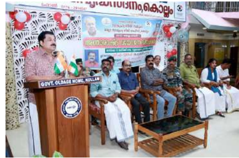
Celebration of World Senior Citizen's Day, inaugurated by Mr.M Mukesh, Honorable MLA of Kollam Constituency