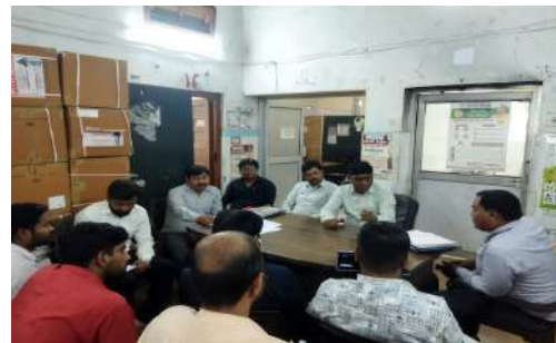
District Review Meeting Lucknow taken by DTO Lucknow Discussion made on all PHA Indicator and Notification Trend Q1

Under the PPSA programme for FY-2023-24, HLFPPT has notified 1,43,019 patients through the private Sector in Maharashtra, Chhattisgarh, Odisha, Uttar Pradesh, and Gujarat State which includes 15,709 patients from Maharashtra, 9,387 patients from Chhattisgarh, 5263 patients from Odisha, 94,492 patients from Uttar Pradesh and 18,168 patients from Gujarat State.