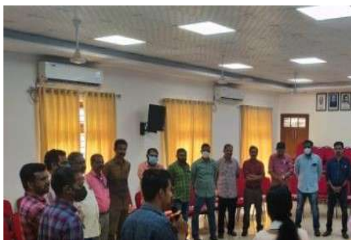
केएसआरटीसी कर्मचारियों के नियमित मेडिकल चेकअप शिविर

केरल राज्य सड़क परिवहन निगम के सहयोग से, एचएलएफपीपीटी ने केएसआरटीसी कर्मचारियों को चिकित्सा सेवाएं प्रदान करने के लिए एक मोबाइल चिकित्सा यूनिट के रूप में केएसआरटीसी बस को डिजाइन एवं परिवर्तित किया है। तिरुवनंतपुरम में शुरू की गई इस पहल में जिले के 21 डिपो शामिल हैं। पिछले साल में, केएसआरटीसी के लगभग 7000 कर्मचारियों को चिकित्सा सेवाएं प्रदान की गई हैं। चिकित्सा यूनिटों के अलावा, एचएलएफपीपीटी ने केएसआरटीसी कर्मचारियों की चिकित्सा रिपोर्टों की जांच करने के लिए वरिष्ठ चिकित्सा अधिकारियों से मिलकर एक मेडिकल बोर्ड बनाया है। बोर्ड कर्मचारियों द्वारा प्रस्तुत चिकित्सा रिपोर्ट की समीक्षा करने के लिए और कर्मचारियों की छुट्टी/स्थानांतरण पर केएसआरटीसी को सुझाव देने के लिए हर महीने बैठक करता है।