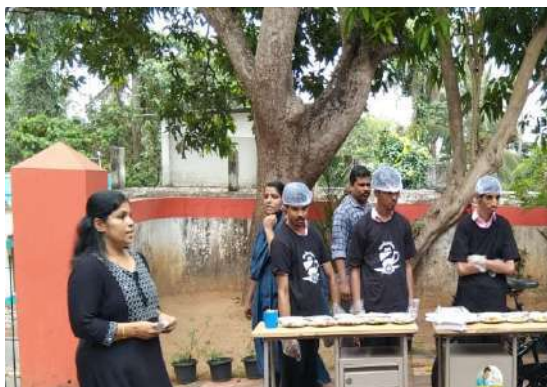
Coffee Shop by inmates of HMDC

Formerly known as Home for Mentally Disabled Children (HMDC), PunnyaBhavan is being run and managed by HLPPT under Social Justice Department, Government of Kerala. With the aim of rehabilitation of mentally challenged children by providing them with a multi-faceted lifestyle including medical care, training for life skills, daily living activities, special education and vocational training on a regular basis. HLPPT has been positively impacting the well-being of resident children, where special attention and care are given by an expert team of therapists, psychologists and special educators. A skill lab for engaging residents in activities like gardening, pot making, paper pen making etc. has also been set up under the program. Additionally, to enhance the motor skills of resident children and equip them for livelihood, an initiative named “AALA” has been launched which includes training in activities like pottery, painting, coffee making etc.