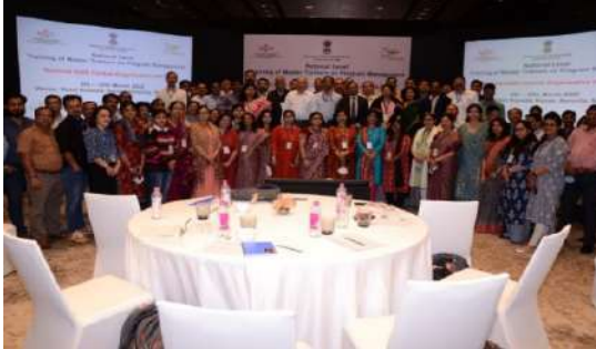
क्षमता निर्माण कार्यक्रम-कार्यक्रम प्रबंधन पर मास्टर प्रशिक्षक के लिए प्रशिक्षण

इस गतिविधि के अधीन एस ए सी एस, टी एस यू और डी ए पी सी यू अधिकारियों के लिए निरंतर क्षमता निर्माण कार्यक्रम आयोजित किए गए हैं और कुल 1664 अधिकारियों (एस ए सी एस अधिकारी - 484, एन ए सी ओ- 27, टी एस यू - 111, डी आई एस एच ए/डी ए पी सी यू - 701, पी एम प्रशिक्षण के लिए एम टी और ब्रिज आबादी - 146, ब्रिज आबादी टी आई कर्मचारी - 195) को 24 मार्च तक प्रशिक्षित किया गया।