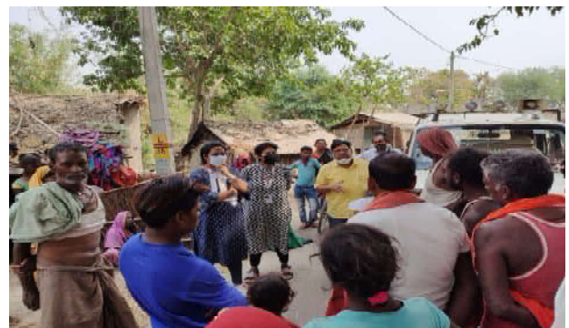
टीबी पर सामुदायिक जागरूकता