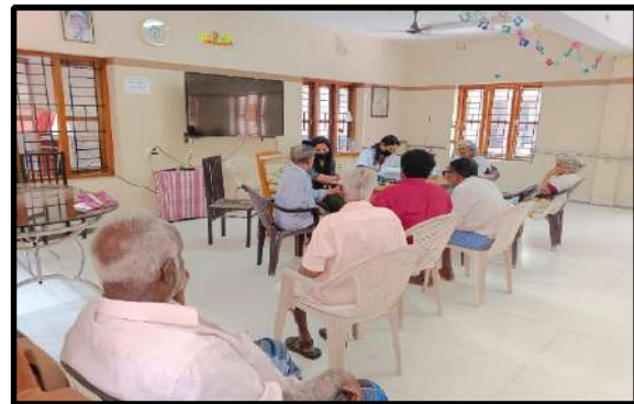
तिरुवनंतपुरम के वृद्धाश्रमों में एचएलएफपीपीटी द्वारा आउटरीच क्लिनिक सेवाएं