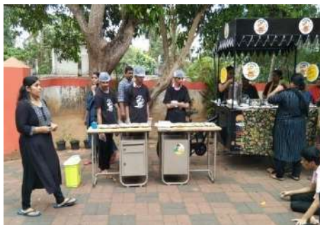
एचएमडीसी के निवासियों द्वारा कोफी शॉप

पूर्व में मानसिक रूप से विकलांग बच्चों के लिए गृह (एचएमडीसी) के रूप में जानने वाला पुण्यभवन, केरल सरकार के सामाजिक न्याय विभाग के तहत एचएलएफपीपीटी द्वारा संचालन और प्रबंधन किया जा रहा है। मानसिक रूप से विकलांग बच्चों को चिकित्सा देखभाल, जीवन कौशल के लिए प्रशिक्षण, दैनिक जीवन की गतिविधियों, विशेष शिक्षा और व्यावसायिक प्रशिक्षण सहित एक बहुआयामी जीवन शैली प्रदान करके पुनर्वास के उद्देश्य से नियमित आधार पर आयोजित किया जा रहा है। एचएलएफपीपीटी निवासी बच्चों की भलाई में सकारात्मक योगदान दे रहा है, जहाँ चिकित्सक, मनोवैज्ञानिक और विशेष शिक्षकों की एक विशेषज्ञ टीम द्वारा विशेष ध्यान और देखभाल दी जाती है। कार्यक्रम के तहत निवासियों को बागबानी, गमले बनाने, पेपर पेन बनाने आदि गतिविधियों में शामिल करने के लिए एक कौशल प्रयोगशाला भी स्थापित की गई है। इसके अतिरिक्त निवासी बच्चों के मोटर कौशल को बढ़ाने और उन्हें जीविका के लिए सज्जित करने के लिए 'आला' नामक एक पहल शुरू की गई है जिसमें मिट्टी के बर्तनों, पेंटिंग, कॉफी बनाने आदि का प्रशिक्षण शामिल है।