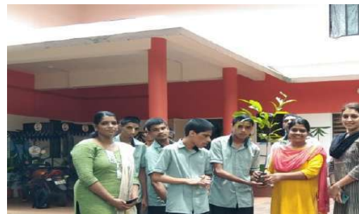
विश्व पर्यावरण दिवस समारोह