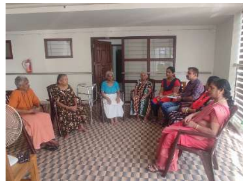
Home for elderly at Guruvayur along with staff

In collaboration with Guruvayur Dewasom Board, HLPPT has been awarded to operationalise Elderly Home in the holy vicinity of Lord Krishna Temple at Guruvayur, Thrissur to facilitate, physical and mental wellness among the residents. Currently there are 8 inmates at the elderly home. We are providing medical care, daily activities with facilitation of full time care takers and nurse.