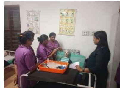
अभ्यर्थियों को बेहतर प्रशिक्षण प्रदान करने के लिए सुसज्जित प्रयोगशालाएं

कौशल प्रभाग को हाल ही में महिला केंद्रित परियोजनाओं से सम्मानित किया गया है। के4 केयर कुडुम्बश्री की एक पहल है जिस में एसएचजी सदस्यों को बुजुर्गों की देखभाल में प्रशिक्षित किया जाता है और उद्यमिता सहायता दी जाती है। बिहार में, कौशल प्रभाग को भर्ती - प्रशिक्षण-तैनाती और महिला उम्मीदवारों के लिए विशेष कौशल प्रशिक्षण जैसे दो प्रमुख कार्यक्रम प्राप्त हुए हैं। उपरोक्त के अलावा, कौशल प्रभाग ने विभिन्न सीएसआर परियोजना को लागू करने में अपनी विशेषज्ञता दिखाई है। एनटीपीसी के सहयोग से, एचएलएफपीपीटी को 180 उम्मीदवारों को प्रशिक्षण प्रदान करने की मंजूरी दी गई है। आईआरएफसी सीएसआर फंडिंग के अधीन, एचएलएफपीपीटी ने दिव्यांग उम्मीदवारों और ओबीसी/ईबीसी उम्मीदवारों को कौशल प्रशिक्षण प्रदान किया है।