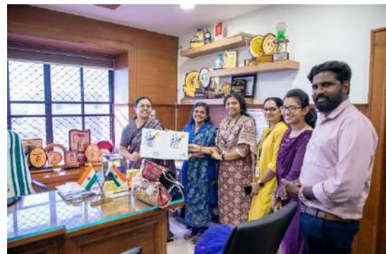
Launching of Brand “Uydare” for the products made by inmates of Thejomaya

With a vision to rehabilitate sexual assault victims, Department of Women and Child Development, Kerala initiated a project named “Thejomaya” for which HLPPT is entrusted with running a home for victims. To support the residents to overcome the trauma of the sexual assault and equip them for a sustainable livelihood by providing them with training, the residents (19) are engaged in various activities diversifying from skill development in various potential areas like stitching, poultry farming and baking for livelihood, to intrapersonal and social development.