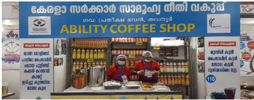
Ability shop by inmates of Pratheeksha Bhawan during the Mela organized by Kerala Govt. The Shop has received award for Best Shop in the Mela