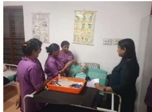
Well Equipped laboratories providing better training to the candidates

Skill division has received two major programs such as Recruit-Train- Deploy and special skill training for women candidates. Apart from the above, Skill Division has shown its expertise in implementing various CSR projects. In association with NTPC, HLPPT has been awarded to provide training to 180 candidates. Under IRFC CSR funding, HLPPT has provided skill training to PwD candidates and OBC/EBC candidates.