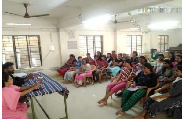
परामर्शदाताओं, जे.जे संस्थागत और गैर - संस्थागत कर्मचारियों को क्षमता निर्माण प्रशिक्षण प्रदान किया गया।