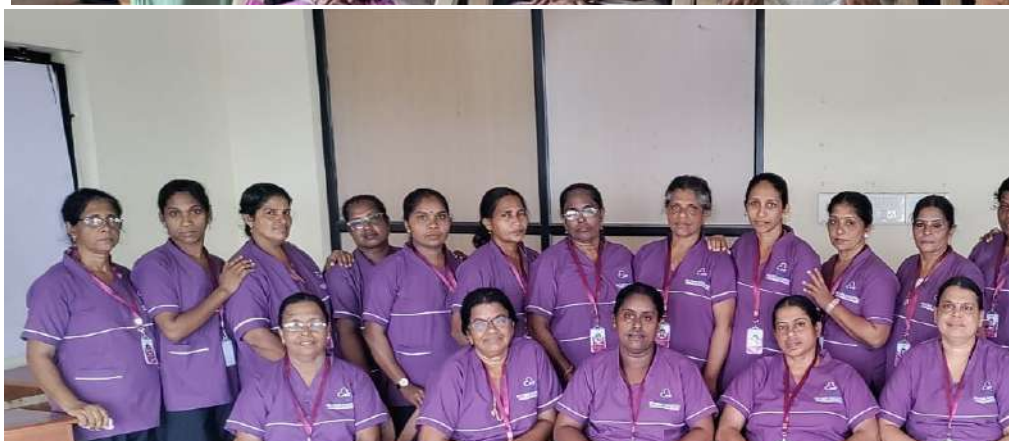
K4 केयर प्रशिक्षण कार्यक्रम के अंतर्गत सफलतापूर्वक प्रशिक्षित अभ्यर्थी