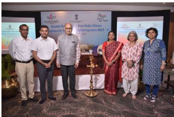
CSS Project Review with SACS Nodal