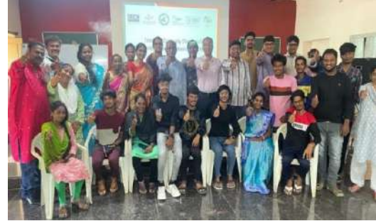
सामुदायिक प्रणाली सुदृढीकरण कार्यक्रम के अंतर्गत सामुदायिक चैंपियंस प्रशिक्षण