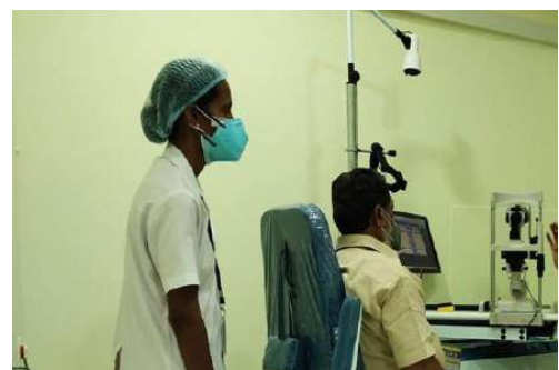
केएसआरटीसी कर्मचारियों के लिए नेत्र चिकित्सा कैंप