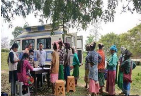
असम के चाय बागानों में मोबाइल मेडिकल यूनिट कार्यक्रम

यह संक्रामक और गैर-संक्रामक रोगों के शीघ्र नैदानिक निदान, जटिल मामलों के रेफरल, क्षय रोग की शीघ्र जांच, यौन संचारित संक्रमण (एस टी आई) की रोकथाम और प्रबंधन, मातृ एवं शिशु स्वास्थ्य (एम सी एच) गर्भावस्था, प्रसवपूर्व जांच (ए एन सी), नवजात शिशु की बुनियादी रक्षा, परिवार नियोजन परामर्श, गर्भिनिरोधकों का प्रावधान आदि के माध्यम से उपचारात्मक और निवारक रक्षा सेवाओं की एक श्रृंखला प्रदान करने के लिए सुसज्जित है। फील्ड डेटा की निगरानी और विश्लेषण डैशबोर्ड के माध्यम से किया जाता है। लोगों के वास्तविक स्वास्थ्य परिदृश्य को समझने के लिए एचएलएलपीपीटी ने परियोजना स्तर पर एक डिजिटल रोगी संबंधी सूचना प्रणाली (एमआईएस) विकसित की है, जिसका उद्देश्य रोगी विवरणों की व्यवस्थित और एकरूप रिकॉर्डिंग लाना है और मोबाइल स्वास्थ्य यूनिटों के लिए एकत्रित आंकड़ों का विश्लेषण करना है। कार्यक्रम के अधीन हमने 2,31,951 स्वास्थ्य शिविर आयोजित किए हैं और 1.29 करोड़ से अधिक समुदाय की सेवा की है।