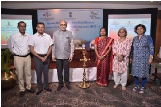
एसएसीएस नोडल के साथ सीएसएस परियोजना की समीक्षा