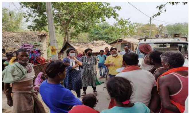
Community Awareness on TB