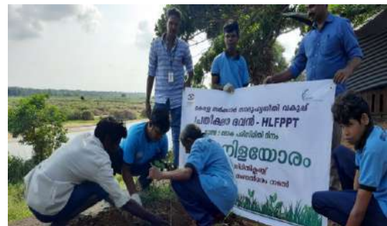
विश्व पर्यावरण दिवस के अवसर पर प्रतीक्षा भवन के निवासियों द्वारा चलाया गया सफाई अभियान।