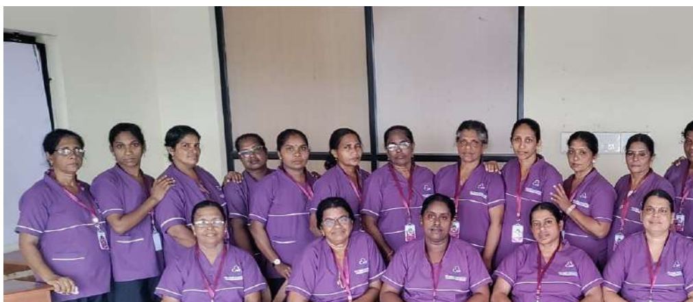
Successfully trained candidates under K4 Care Training programme