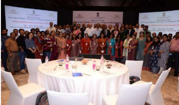
Capacity Building Programme- Training of Master Trainers on Program Management

Under this activity continuous capacity building programs have been organised for SACS, TSU and DAPCU officials and total 1664 officials (SACS Officials – 484, NACO – 27, TSU – 111, DISHA / DAPCU – 701, MT's for PM training and bridge populations – 146, Bridge Populations TI staff - 195) got trained by March 24