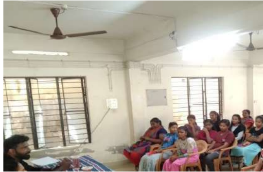
Capacity Building Training provided to counsellors, JJ institutional and non-institutional staffs