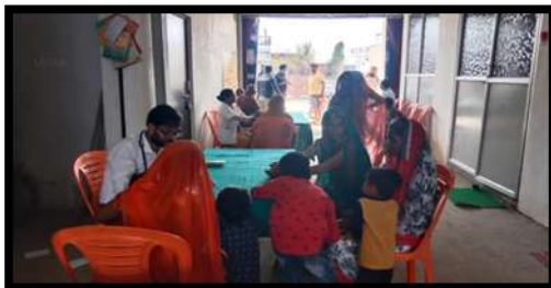
विशेष स्वास्थ्य शिविर के माध्यम से ओपीडी

प्रत्येक स्वास्थ्य शिविर में गैनकोलॉजिस्ट, ई एन टी विशेषज्ञ, डेरमटोलॉजिस्ट, नेत्र रोग विशेषज्ञ और सामान्य चिकित्सक जैसे कई विशेषज्ञ थे। ये शिविर नियमित ओपीडी के साथ-साथ आँखों की जाँच के बाद मुफ्त रूप से चश्मे का वितरण, एच आई