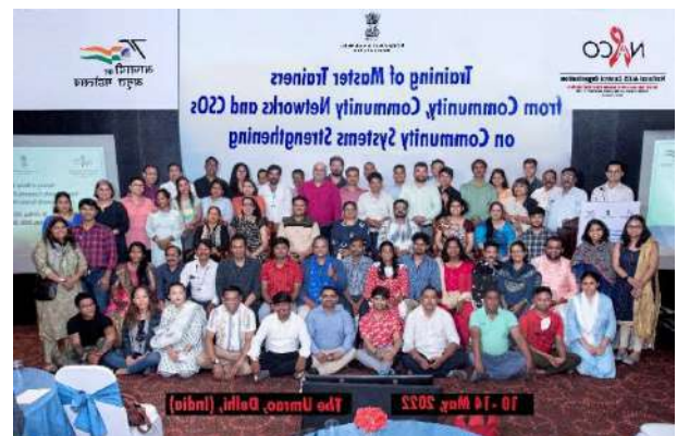
Training of Master Trainers under CSS Programme