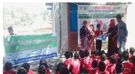
Adolescent Health Day (AHD) celebration under RKSK Project in Barwani district of MP

HLFPPT is implementing the Rashtriya Kishore SwasthyaKaryakram (RKSK) programme in Singrauli and Barwani districts of Madhya Pradesh in order to ensure the holistic development of the adolescent population. The thrust of the programme is on six major areas to develop a community-based approach to health promotion under-nutrition, sexual & reproductive health, injuries, and violence including gender-based violence, non-communicable diseases, mental health and substance misuse. Under this community-based intervention, HLPPT has capacitated and imparted comprehensive training (including District & Block Levels) in Madhya Pradesh to Master Trainers, ASHAs, ANMs, MPWs, LHV, etc. Clinical and counselling services are being provided to adolescents through Adolescents Health Friendly Clinics based at Community Health Centres and District Hospital.