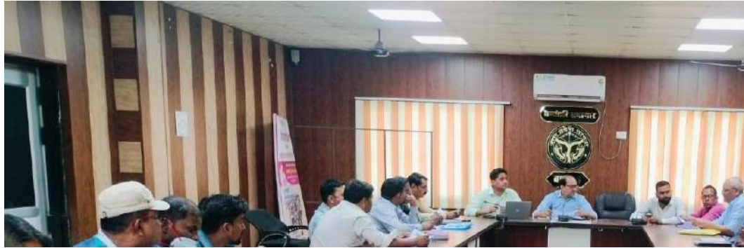
Meeting with District TB officers and PPSA team in Bahraich, U.P.

HLFPPT acts as an interface agency between NTEP & Private Healthcare systems by supporting Private Health Sector in providing quality and free TB Care services. To increase the TB notification from the Private Sectors, a total of 60 districts in 5 states are covered with the aim to accelerate early detection of TB cases in the high-risk group. At present, HLFPPT is implementing TB Care programme as Private Provider Support Agency (PPSA) in 5 districts of Maharashtra state, 6 districts of Chhattisgarh, 3 districts of Odisha, 12 districts of Gujarat and 10 districts of Uttar Pradesh. We have added 18 new districts under PPSA programme in the state of Uttar Pradesh (8) and Maharashtra (10).