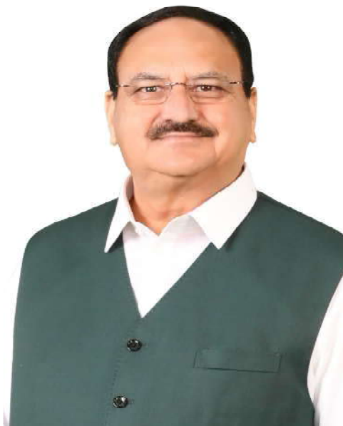
श्री जगत प्रकाश नड्डा