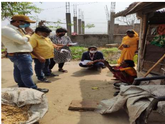
Interviewing DRTB Patients

HLFPPT with support of Central TB Division (CTD) of the Ministry of Health & Family Welfare (MoHFW), Government of India, is implementing State Technical Support Units (STSUs) to improve Tuberculosis control efforts in targeted states of India- Bihar, Karnataka, and Madhya Pradesh. These units aim to achieve the common goal of TB elimination by 2025. Each STSU consists of a team of 11 experts, comprising 2 managerial and 9 domain experts, who provide assistance to state TB cells. Their responsibilities include managing extensive engagement with the private sector, strategic purchasing, facilitating Direct Benefit Transfer (DBT), and fostering collaboration across various sectors. With the support of STSUs, private sector TB notifications significantly increased in the targeted states in 2023 compared to 2022: from 74,117 to 88,586 in Bihar, 27,279 to 30,352 in Karnataka, and 56,965 to 60,561 in Madhya Pradesh.