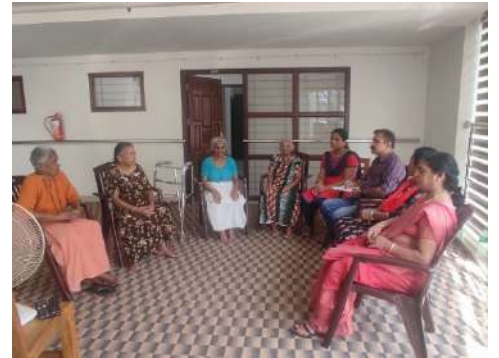
गुरुवायुर के बुजुर्गों के लिए घर में वहाँ के स्टॉफ

गुरुवायुर देवसम बोर्ड के सहयोग से, एचएलएफपीपीटी को भगवान कृष्ण मंदिर के पवित्र मंदिर गुरुवायुर, त्रिशूर में बुजुर्गों के लिए घर संचालित करने का काम सौंपा गया है, ताकि निवासियों के बीच शारीरिक और मानसिक स्वास्थ्य की सुविधा प्रदान की जा सके। वर्तमान में बुजुर्गों के लिए घर में 8 लोग हैं। हम पूर्णकालिक देखभाल करनेवालों और नर्स की सुविधा के साथ चिकित्सा देखभाल, दैनिक गतिविधियाँ प्रदान कर रहे हैं।