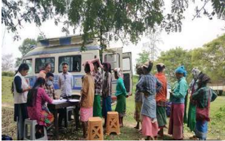
Mobile Medical Unit Operating in Tea Gardens of Assam

It is equipped to provide range of curative and preventive care services by early clinical diagnosis of communicable diseases and non-communicable diseases; referral of complicated cases; early screening of Tuberculosis, Sexual Transmitted Infection (STI) prevention and management, maternal and child health (MCH) pregnancy; antenatal check-up (ANC) check-ups; basic new-born care; family planning counselling; provision of contraceptives; etc. The field data is monitored and analysed through a DASHBOARD. To understand the actual health scenario of the people HLPPT has developed a Digital Patient Management Information System (MIS) at the project level with the objectives to bring a systematic and uniform recording of patient details; and analyse the collected data for the Mobile Health Units. Under the programme we have conducted 2,31,951 health camps and served more than 1.29 crore community.