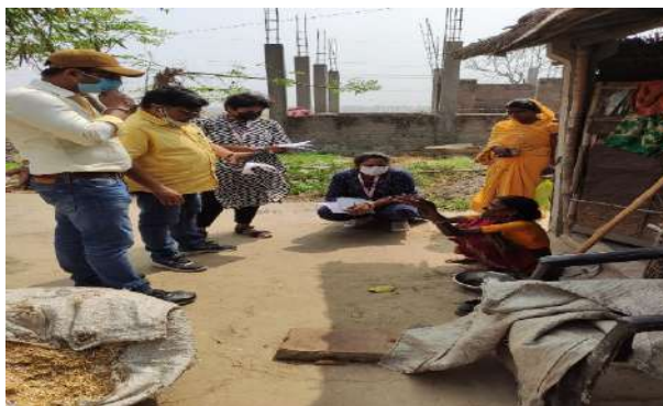
डीआरटीबी रोगियों के साथ बातचीत

भारत सरकार के स्वास्थ्य और परिवार कल्याण मंत्रालय (एमओएचएफडब्ल्यू) के केंद्रीय टी बी प्रभाग(सीटीडी) के समर्थन से एचएलएफपीपीटी, भारत के लक्षित राज्यों - बिहार, कर्नाटक और मध्य प्रदेश में टी बी नियंत्रण प्रयासों को बेहतर बनाने के लिए राज्य तकनीकी सहायता यूनिटों (एसटीएसयु) को लागू कर रहा है। इन यूनिटों का लक्ष्य 2025 तक टी बी उन्मूलन के सामान्य लक्ष्य को हासिल करना है। प्रत्येक एसटीएसयु में 11 विशेषज्ञों की एक टीम होती है, जिसमें 2 प्रबंधकीय और 9 डोमेन विशेषज्ञ शामिल होते हैं, जो राज्य टी बी सेल को सहायता प्रदान करते हैं। उनकी जिम्मेदारियों में निजी क्षेत्र के साथ व्यापक जुड़ाव का प्रबंधन, सामरिक खरीद, प्रत्यक्ष लाभ हस्तांतरण (डीबीटी) की सुविधा प्रदान करना और विभिन्न क्षेत्रों में सहयोग को बढ़ावा देना आदि शामिल है। एसटीएसयु के समर्थन से, 2022 की तुलना में 2023 में लक्षित राज्यों में निजी क्षेत्र की टीबी अधिसूचनाओं में उल्लेखनीय वृद्धि हुई : बिहार में 74,117 से 88,586, कर्नाटका में 27,279 से 30,352 और मध्य प्रदेश में 56,965 से 60,561.