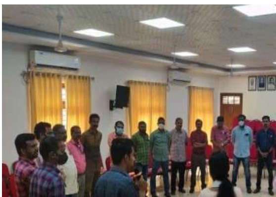
Regular medical check up to KSRTC employees

In association with Kerala State Road Transport Corporation, HLPPT has designed and converted KSRTC bus into a mobile medical unit providing medical services to KSRTC employees. The initiative started in the Trivandrum covers 21 depots in the district. Over the past year, the medical services has extended to around 7000 employees of KSRTC. Apart from the medical units, HLPPT has created a medical board consisting of senior medical officers to examine the medical reports of KSRTC employees. The board sits every month to review the medical reports submitted by the employees and make suggestions to the KSRTC on employees' leave/ transfer.