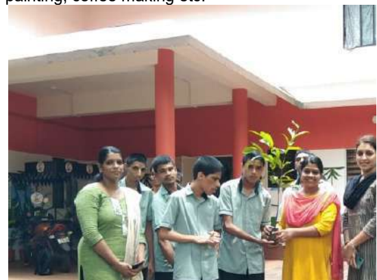
Celebration of World Environment Day