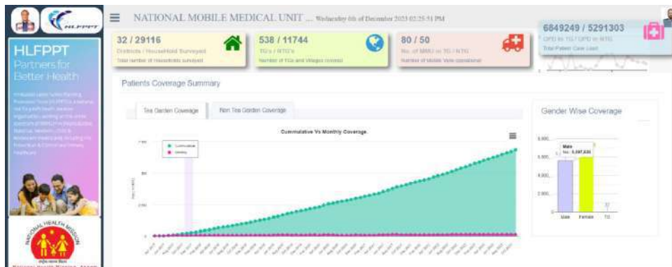
मोबाइल मेडिकल यूनिट डैशबोर्ड, असम