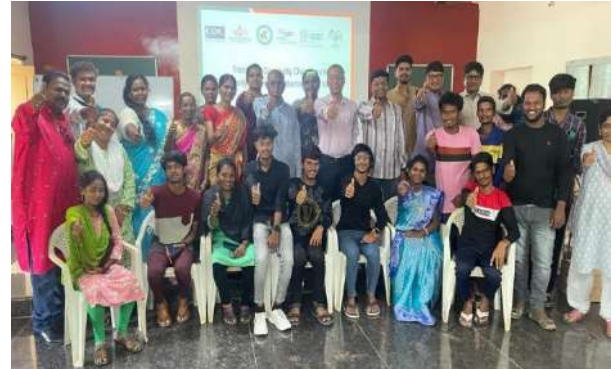
Community Champions Training under Community System Strengthening Programme