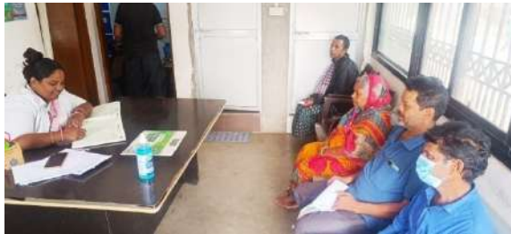
थेलकोलोई डिस्पेंसरी, ओडिशा में मरीजों का पंजीकरण

हम जिंदल स्टील वर्क्स (जे एस डब्ल्यू) के सहयोग से थेलकोलोई, संबलपुर (ओडिशा) में एक सामुदायिक औषधालय और पारदीप (ओडिशा) में 1 मोबाइल मेडिकल यूनिट (एमएमयू) का संचालन और प्रबंधन कर रहे हैं, ताकि समुदाय को प्राथमिक स्वास्थ्य सेवाएँ प्रदान की जा सकें, जिसका उद्देश्य सार्वभौमिक स्वास्थ्य कवरेज सुनिश्चित करना है। प्रमुख उपलब्धियाँ : कुल पंजीकृत मामले 11358, नए पंजीकरण मामले 5038, अनुवर्ती मामले 6320 और रेफरल मामले 49।